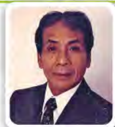
李錦泉 香港棒球總會會長