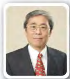
李永權 香港棒球總會主席