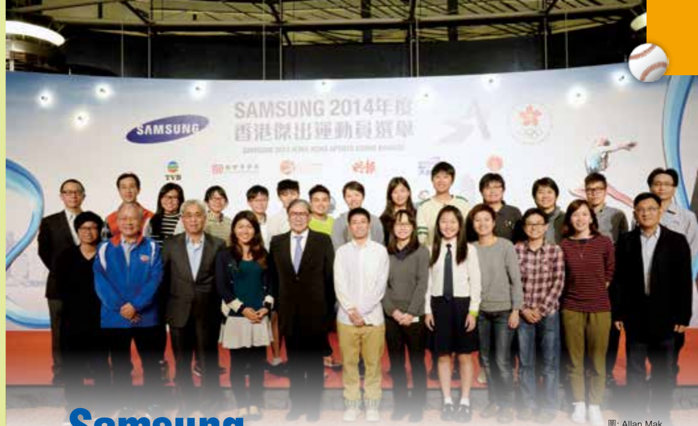
圖: Allan Mak