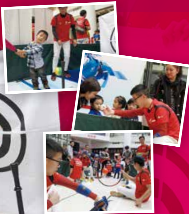
Organizer: Hong Kong Baseball Association Co-organizer: Kwun Tong Maryknoll College Devil-Z Baseball Team