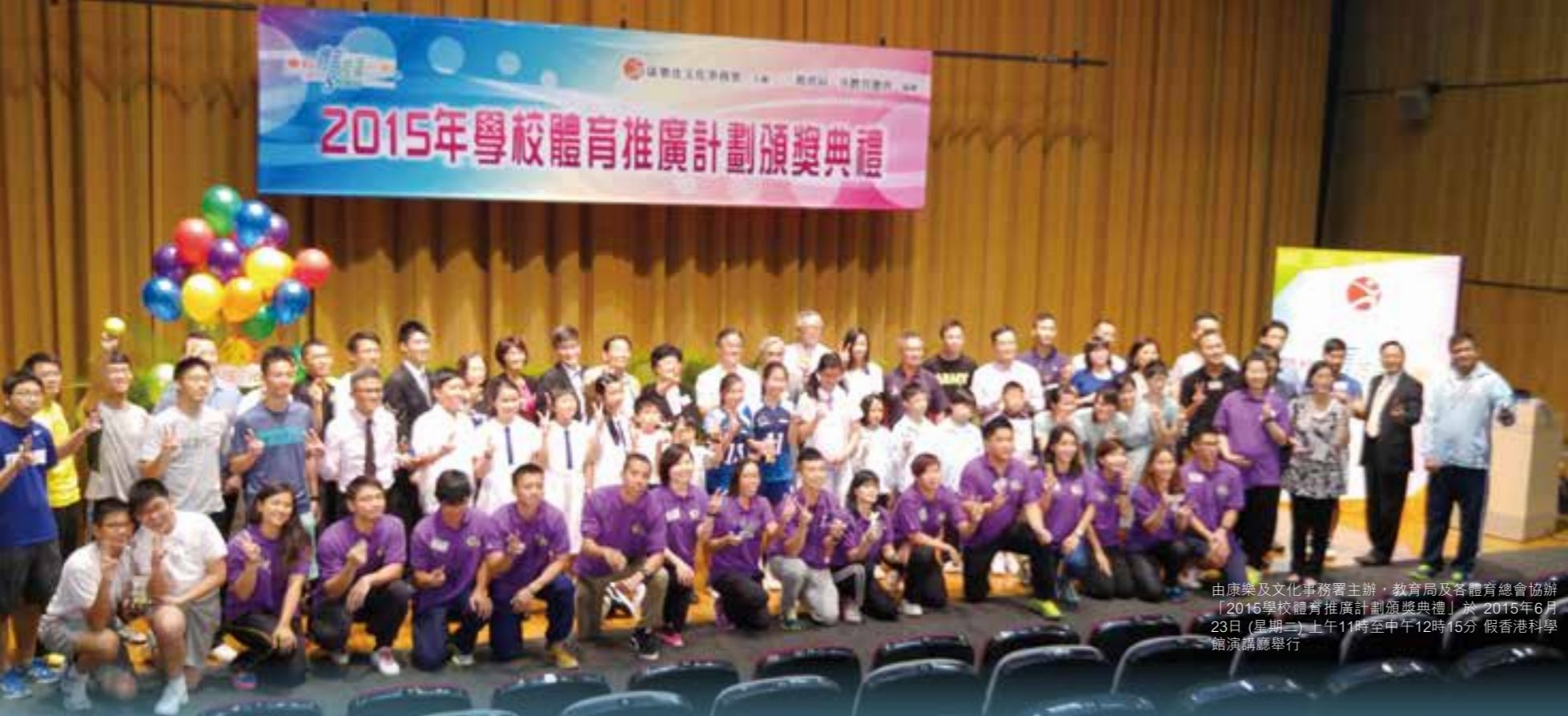
由康樂及文化事務署主辦，教育局及各體育總會協辦「2015學校體育推廣計劃頒獎典禮」於2015年6月23日（星期二）上午11時至中午12時15分假香港科學館演講廳舉行