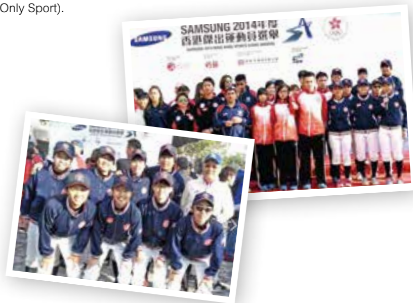
Public Voting Announcement Press Conference of the Samsung 2014 Hong Kong Sports Stars Awards 10. 1. 2015 Hong Kong Cultural Centre Piazza A