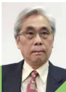
李永權 香港棒球總會會長