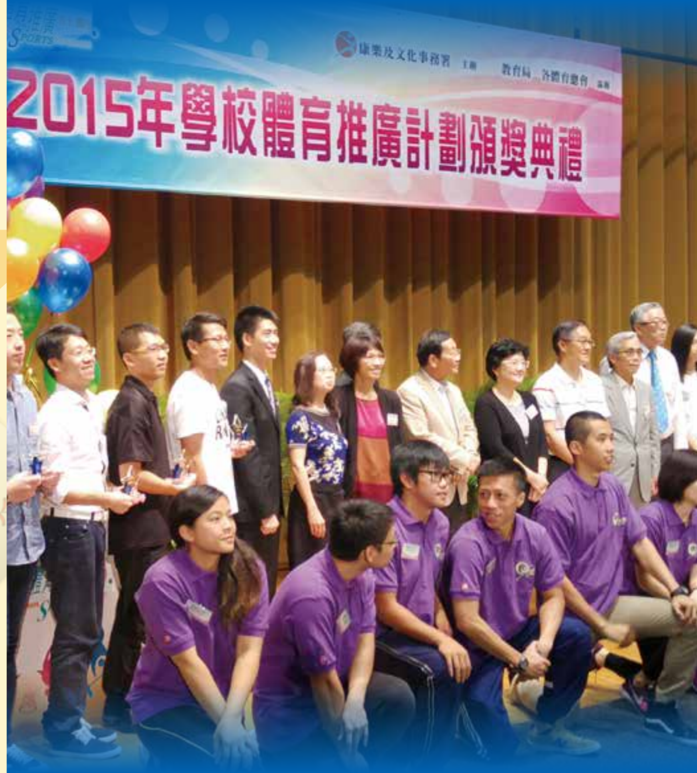
由康樂及文化事務署主辦，教育局及各體育總會協辦「2015學校體育推廣計劃頒獎典禮」於2015年6月23日假香港科學館演講廳舉行