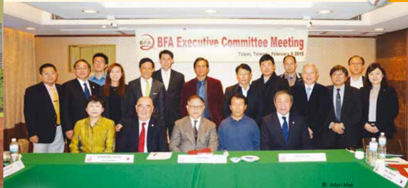
圖: Allan Mak