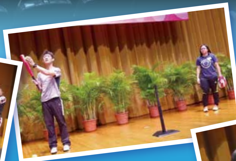
2015-16年度新增項目示範: Thai boxing 及壘球