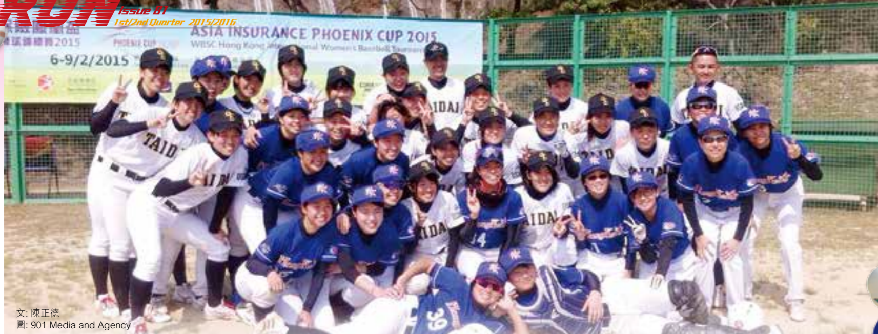
文：陳正德