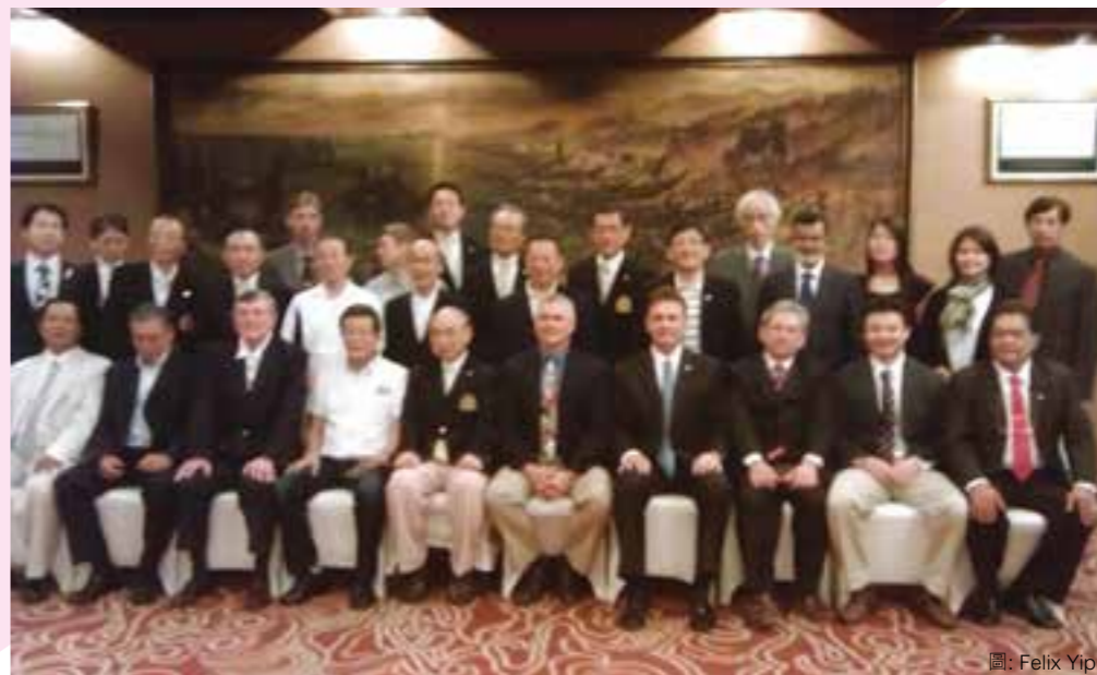
圖: Felix Yip