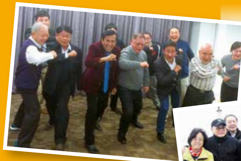
Taipei, Taiwan February 9, 2015